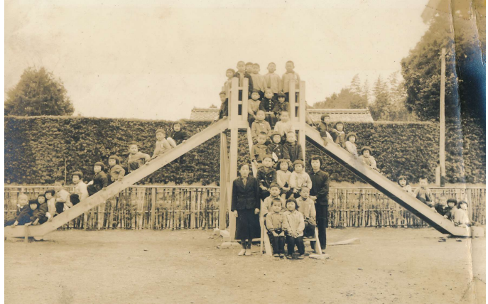
昭和31年 一鍬田幼稚園にできたばかりのすべり台

ぼくは家からてくてく歩いて行 きました。私は、先生が自転車を 引いていっしょに歩いて行ったこ とを覚えていますよ。