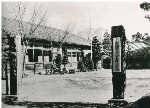
昭和41年 当時の八名井小学校

授業中でも吉祥山や豊川へ行って遊ば せてもらいましたよ。何の時間だったか 覚えていないけど、けっこう自由に外へ 出て楽しむゆとりがありましたね。それ を思うと、今の子どもたちは教科ごとに 勉強がぎっしり詰められて、ちょっと気 の毒な気がしますね。